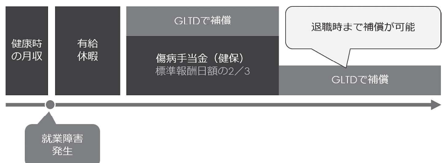
図表 GLTDの補償イメージ

以上のように、GLTDの導入は新規採用のみならず従業員の定着にも貢献することができますので、他社に先がけて導入することをお勧めします。