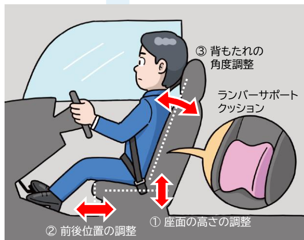
図2. シート調整の一例

調整後、シートは身体の一部だけではなく全体を優しく支えていますか。また太ももが座面に当たらず、安定して座れていますか。もしそうっていない場合は、一部の筋肉が緊張しやすい、またはシートにより体の一部が圧迫されて疲れやすい状態かも知れません。座り直したり、シート高さや前後位置を微調整したりしてみましょう。ランバーサポート(腰当て)クッションの利用も考えられます。第三腰椎(図3)付近にクッションをあてることで疲労軽減効果が高いとする報告※2もあります。